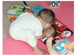
▲自我のめばえ体験

「あそびの環境を作ってあげる」ことで“好きなこと”や“得意なこと”が増えていきます。子どもたちが昨日までできなかったことが出来るようになった時や、感じる心が育っている瞬間に出会えた時、胸いっぱい幸せを感じます。